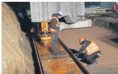
Ständig wurde der Zustand der Schienen kontrolliert.