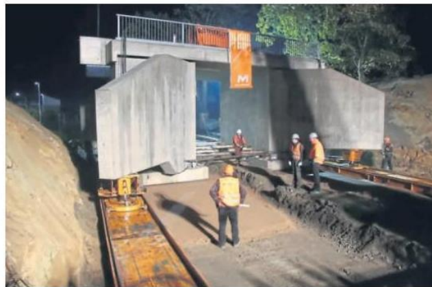
Zentimeterweise schoben Fachleute am Freitag die neue, rund 400 Tonnen schwere Brücke an ihren Platz im Bahndamm.

Seit März war hier an der Erneuerung der mehr als 100 Jahre alten Brücke gearbeitet worden. Zunächst hatten Bauunternehmen die neue Brücke neben der alten errichtet, am Mittwoch begann dann der Abriss der alten Brücke, bevor der Untergrund eingeebnet wurde, um Schienen verlegen zu können, auf denen die neue Brücke an ihren Standort gelangen sollte. Auf diesen Schienen trugen schließlich vier Hydraulikstempel das Bauwerk, während es über eine Strecke von etwa 25 Metern zentimeter-