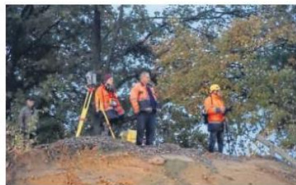
Per Laser behielt man die Position der Brücke stets im Blick.

Nach gut einer Dreiviertelstunde hatte die Brücke problemlos ihr Ziel erreicht. Schon während des Transports hatte der Abbau der Schienen auf der bereits zurückgelegten Strecke begonnen, und gleich im Anschluss stellten die Bauarbeiter die Verbindung zwi-